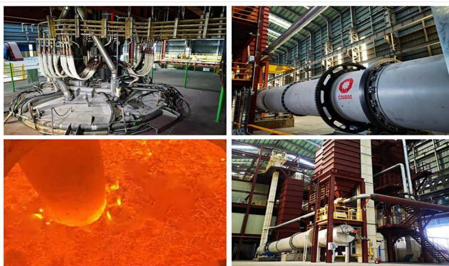
图：南京玻纤院电熔法岩棉纤维生产线在韩国成功投产

助力打赢蓝天保卫战。 半个多世纪以来，南京玻纤院一代又一代环保卫士，潜心钻研过滤膜材料研发和系列化产品开拓，彻底完成了 ePTFE 膜的国产化研制，打破国外垄断，创造了国内环保膜过滤材料史上的多项第一，在我国环保事业发展进程中留下浓墨重彩的一笔。系列覆膜滤料产品和产业化技术，在水泥、火电、钢铁等行业广泛应用，滤除 PM2.5 效率高于 99.99%，烟气粉尘排放浓度低于每立方米 10 毫克，实现趋零排放，产品通过了美国环保局(EPA)环境技术认证(ETV)，总体技术达到国际先进水平。南京玻纤院人用智慧和热血捍卫初心，以技术优势推动绿色低碳发展，助力“碳达峰”“碳中和”目标实现，为我国节能和环保事业做出了应有的贡献，还地球山清水秀草绿天蓝。