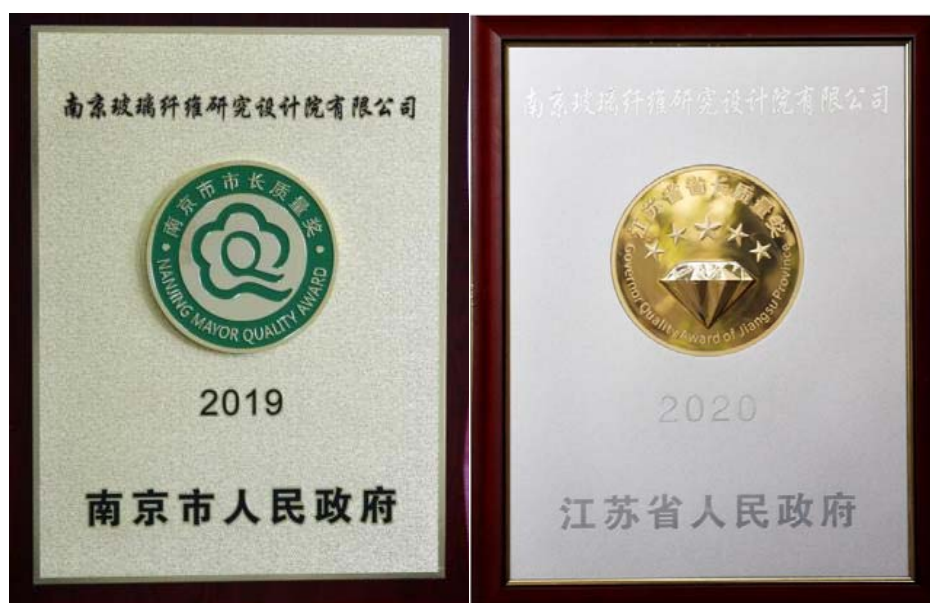
图：企业所获质量方面荣誉

南京玻纤院高度重视环境保护工作，将质量安全视为企业发展的生命，严格遵守《中华人民共和国环保法》《固体废弃物污染环境防治法》等各项国家相关法律法规，建立了《生产安全及环境污染事故责任追究规定》和《生产安全及环境污染事故责任约谈规定》。始终秉持“安全第一、预防为主、综合治理”的方针，注重节约型企业建设，以隐患排查治理为重点，以环境、职业健康安全管理体系为指南，坚持“以人为本”的管理思想，设立更为严格的企业标准。南京玻纤院秉承为相关方创造价值的经营宗旨，建立了纵向到底，横向到边的无缝隙质量安全环保管理网络体系，通过了职业健康安全管理体系，环境管理体系认证，安全生产标准化等认证，先后获得南京市“市长质量奖”和江苏省“省长质量奖”。