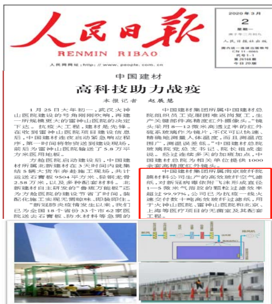
图：院疫情防控事迹被人民日报报道

除了上述膜材料得到应用以外，南京玻纤院的参股企业春辉科技公司、孵化企业双威生物公司也提供了相关先进产品应用于医学检测与治疗仪器，通过创新材料助力提升医疗水平。其中春辉公司采用随机排列技术及光能量均分技术制作的非通信光纤光束，配套于酶标仪和全自动生化分析仪，用于病毒检测，大大提高病原微生物和病毒含量检测效率和准确度，在疫区的医疗系统广泛应用。双威生物公司开发的一次性使用密闭式吸痰管可避免由于吸痰时引起患者呛咳痰液以及气溶胶四溅，从而保护医护人员安全，避免交叉感染，为支援国家打赢抗击疫情攻坚战尽一份力量。