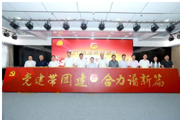
图：G12 团建共建联盟成立仪式成功举行

南京玻纤院与江苏省其他几家单位自发组成 G12 党建联盟。江苏省委组织部 G12 “创新引领 匠心筑梦” 主题党日活动于 2018 年 6 月在滕州成功举办。活动由南京玻纤院承办，得到了滕州市委市政府的高度重视和大力支持。2020 年 9 月 16 日下午，“党建带团建 合力谱新篇”——G12 团建共建联盟成立仪式在大恒集团举行。此次共建是以 G12 党建共建联盟为基础，15 家单位团组织及青年积极顺应群团共建、融合发展大势。