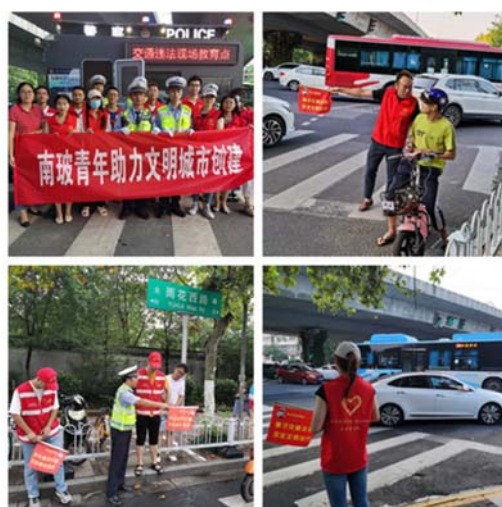
图：南京玻纤院志愿者助力南京文明城市创建

推动社区和谐发展。 南京玻纤院作为积极承担社会责任的企业公民，积极参与社区建设，实现社区和谐发展。南京玻纤院积极与社区各组织共同推进社区文明建设，实现共赢，不仅有效宣传了南京玻纤院的品牌，同时树立了良好的企业形象。开展爱国卫生运动，改善院区生产、生活环境。建立安全环保、职业健康体系，推行设备节能评估体系和节能减排指标体系，推动节能减排。每年拿出一定费用改善院区生产、生活环境，调做好家属区房屋翻新改造。设立“绿色环保箱”，开展垃圾分类、减少废弃电池对大地的严重污染，引导和教育员工树立环保意识。疫情期间，积极参与配合玻纤院社区疫情联防联控。